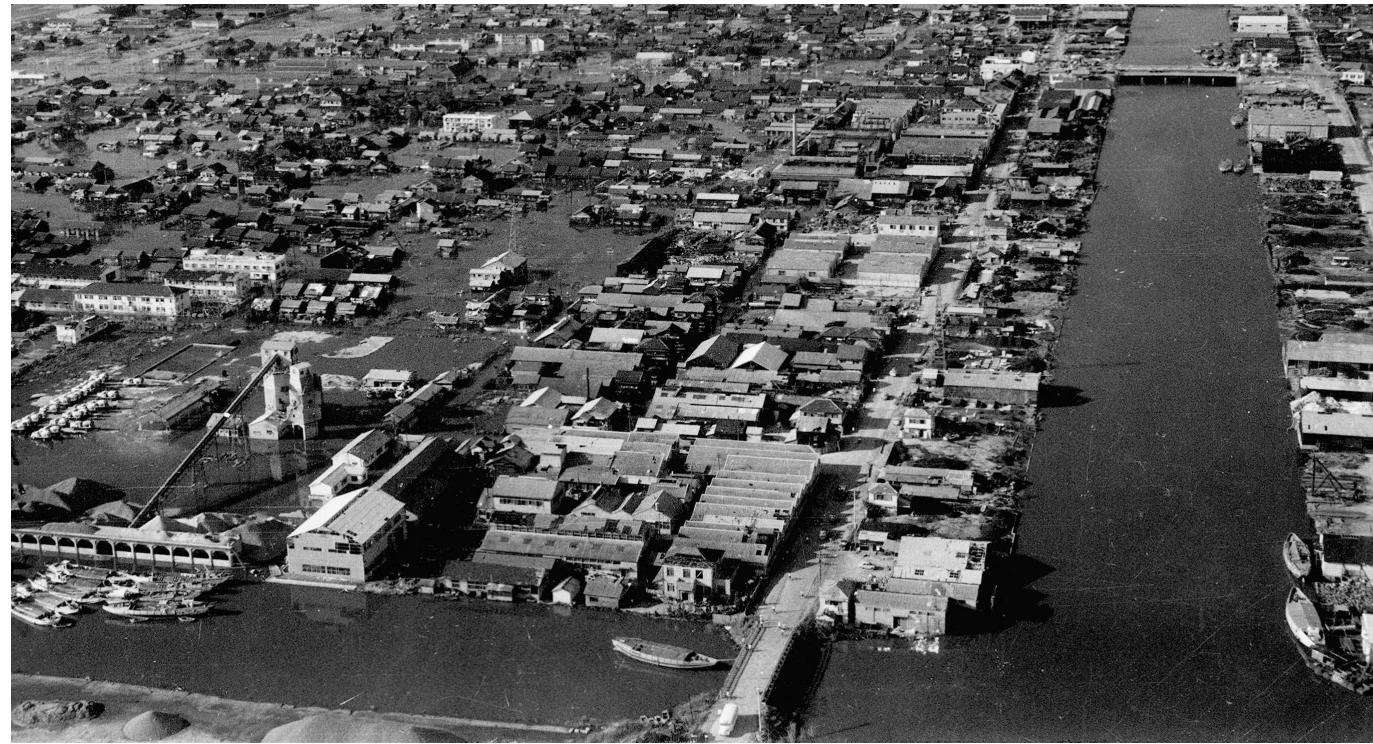
伊勢湾台風直後の中川運河付近

名古屋市南西部は、水害のリスクに対して非常に脆弱な土地です。そうした条件下では、比高わずか1〜2mほどの微高地でも、優れた防災力を発揮することがあります。1959年に発生した伊勢湾台風直後の中川運河付近の写真を見ると、一帯が浸水被害に見舞われるなかで、人工の自然堤防の背骨にあたる道路の乾いた路面が印象的に映ります。